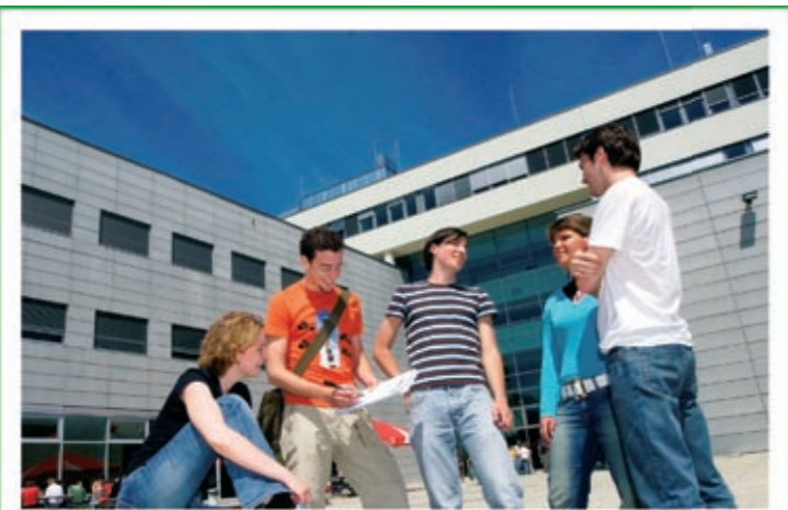
Die FH Joanneum bietet nach dem Vollausbau durch die GBG Platz für mehr als 2000 Studierende.

LISA RÜCKER BÜRGERMEISTER-STELLVERTRETERIN