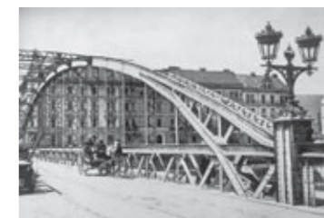
Die Keplerbrücke als technische Musterarbeit (1882–1962).