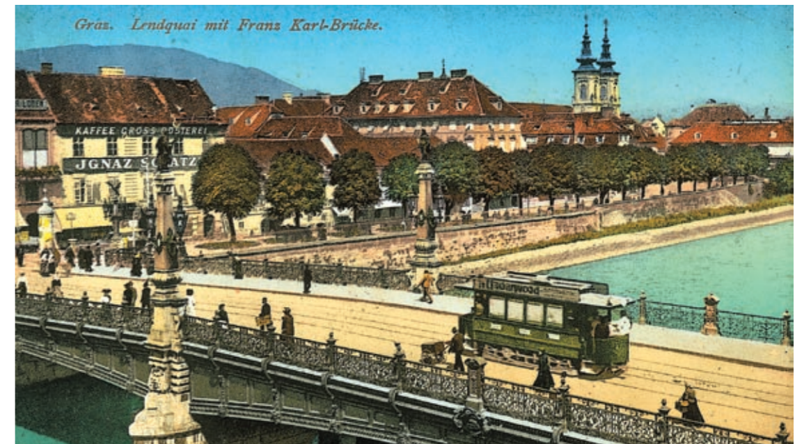
Die Franz-Karl-Brücke (nun hier die Hauptbrücke) um 1910.