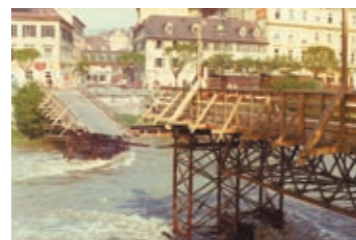
Im Mai 1975 versank die Notbrücke (Ersatz für Tegetthoffbrücke).