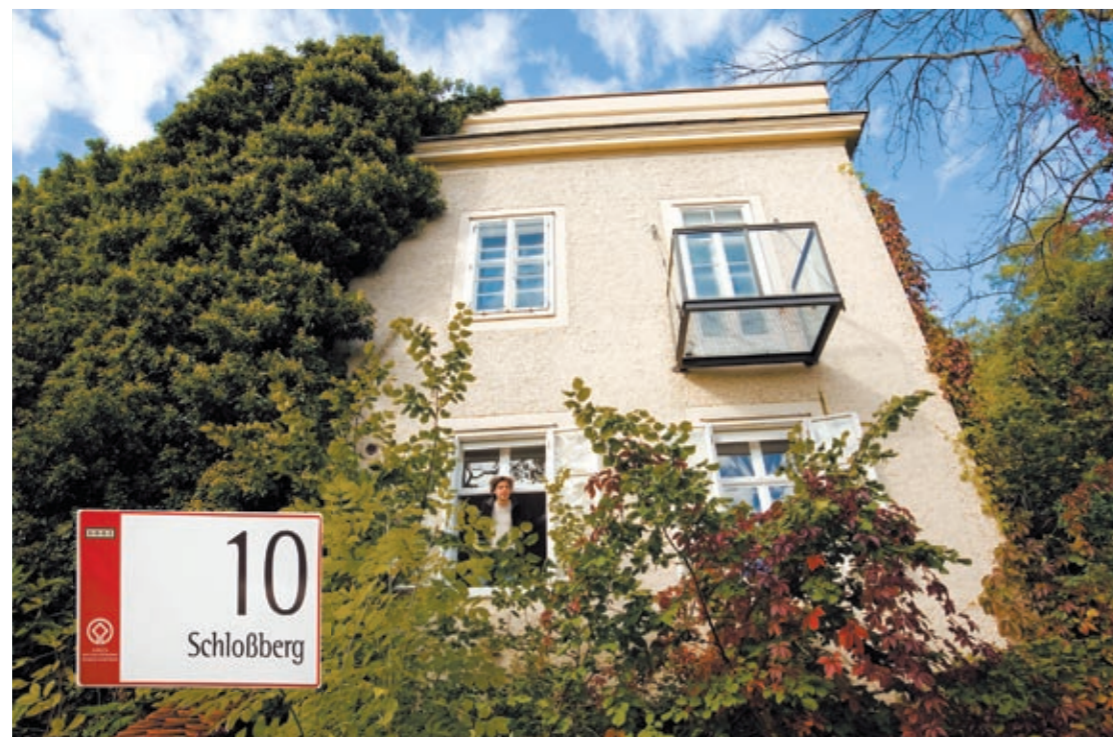
Cerrini-Schlössl klingt hochtrabend: Zwar muss man ganz schön hoch hinauftraben, aber oben angekommen, findet sich kein Anzeichen von Pomp.

Infos: Tel.: +43 3476/2677 | Fax: DW-503 24-stunden-schwimmen@parktherme.at www.parktherme.at