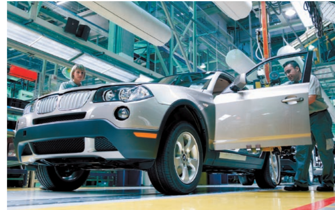
Letzte Handgriffe am BMW X3: Ein Auto-Superstar, gefertigt bei Magna in Graz.