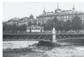
Die Radetzkybrücke beim Hochwasser von 1938.