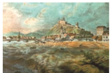
Die Mur als reißen- der Fluss: Das Hochwasser 1827...

eine prächtige im historischen Stil geschmückte Brücke, der viele Grazer nachtrauern. Die gegenwärtige Hauptbrücke (seit 1964) ist so originell wie ihr Name. Die „neue Brücke“ stand einst an jener Stelle, an der sich heute die Radetzkybrücke (erneuert 1995) befindet. Manche Grazer erinnern sich noch an die hölzerne ältere Weinzödlbrücke samt ihrer Wehranlage. Sie wurde errichtet, um den Flößen die Fahrt durch die Wasserstrudel zu entschärfen. Noch 1974 konnte man als Fußgänger auf der Tegetthoffbrücke durch die Fugen der Bodenbretter in den Fluss sehen. Nun nutzen wir (zu wenig) die neue Murpromenade. Ob das Wortspiel mit dem Graz-(a)M(o)ur heute noch berechtigt ist?