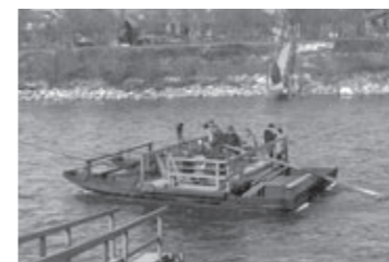
Die Überfuhr beim Kalvarienberg um 1950.