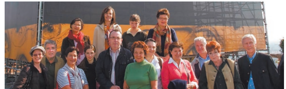
Eine Woche später war das Wahrzeichen schon hinter der Fassadenwerbung „verschwinden“.