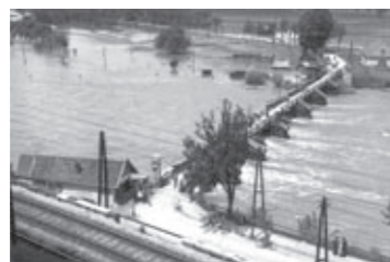
...und hier bei der alten Weinzödlbrücke um 1940.