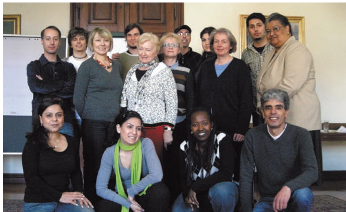
Die KonfliktberaterInnen erhielten eine spezielle Schulung mit Rollenspielen und Reflexionen.

Ein Wochenende lang wurden die 16 KonfliktberaterInnen gezielt für ihre Aufgabe geschult, seit Mai stehen sie nun für Einsätze bereit. Gemeinsam sprechen sie neben Deutsch elf Fremdsprachen wie Türkisch, Serbisch, Arabisch, Kurdisch und Persisch. Ihre Aufträge erhalten sie vom Integrationsreferat der