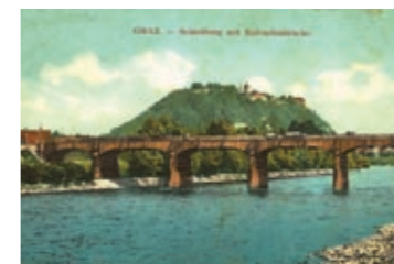
Die Kalvarienbrücke (erbaut 1884), um 1912.