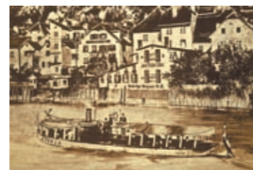
Der glücklose Murdampfer „Styria“ ging 1889 unter.