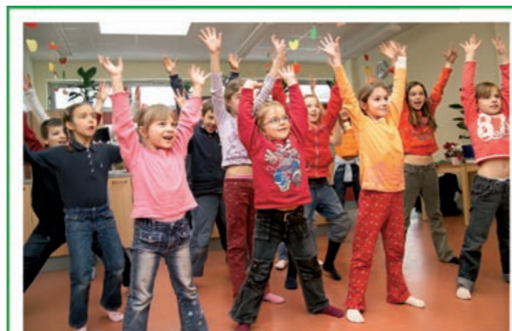
Die GBG - verantwortlich für 45 Schulen sowie 27 Kinderkrippen, Kindergärten und Horte

Innenhöchstzahlen, die zunehmend Raum erfordern. Diesem wird mit diversen Zu-, Um- und Ausbauten seit Jahren Rechnung getragen, große „Brocken“ befinden sich im Planungsstadium (siehe Kasten rechts). Über die Notwendigkeit hinaus hat es durchaus symbolischen Wert, dass mit der künftigen Volksschule Mariagrün erstmals seit zwei Jahrzehnten ein völliger Neubau Form annimmt. Einst vierklassig konzipiert, beherbergt die derzeitige VS acht Klassen und platzt damit aus allen Nähten. Der Neubau in der Schönbrunnngasse schafft räumliche Abhilfe und beinhaltet eine Premiere: LehrerInnen-, Eltern- und SchülerInnenvertreter waren in die Planung eingebunden, ihr Bedürfnis- und Bedarfskatalog ist der Ausschreibung für den Architekturwettbewerb beigelegt.