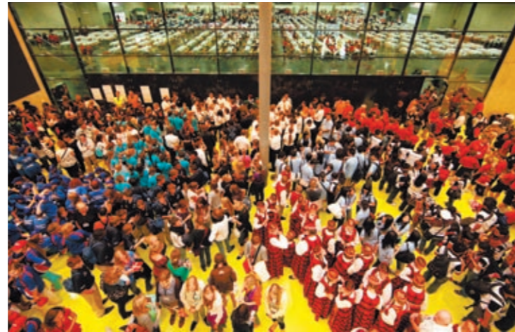
So wandlungsfähig ist die Stadthalle: 11.000 Rockfans feierten beim „Linkin Park“-Konzert, 120.000 BesucherInnen sangen bei den „World Choir Games“, edle Location für Galas und Bälle, perfekte Infrastruktur für Kongresse und Firmenpräsentationen (v. l.).