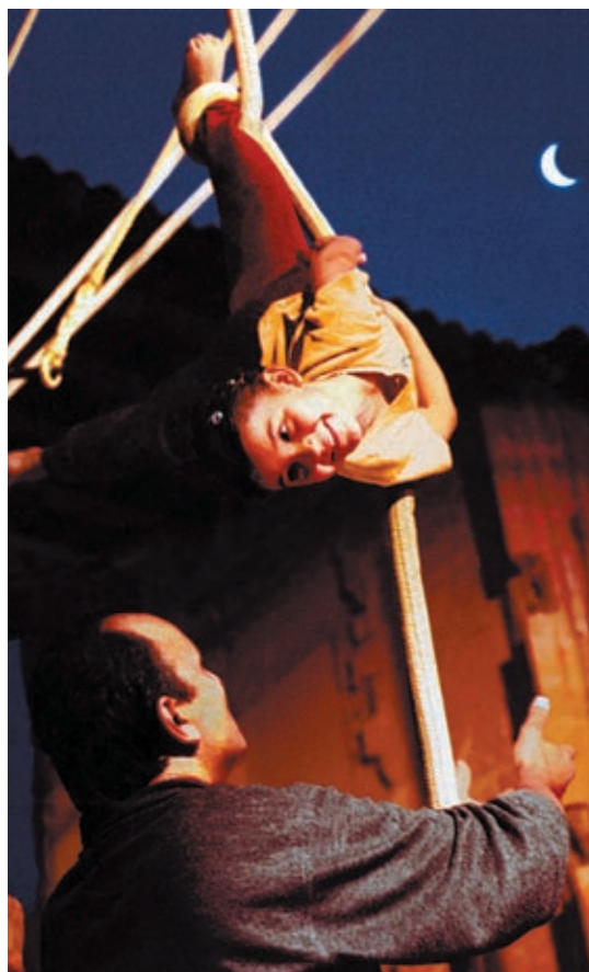
Zirkus-Poesie mit Cirque Noël.

Das ist doch ein außergewöhnliches Weihnachtsgeschenk: Wählen Sie Ihr Wunschhotel, den Termin für Ihren Besuch beim „Cirque Noël“ – und Graz Tourismus schenkt den ersten 100 BucherInnen die Eintrittskarte für die zweite Person!