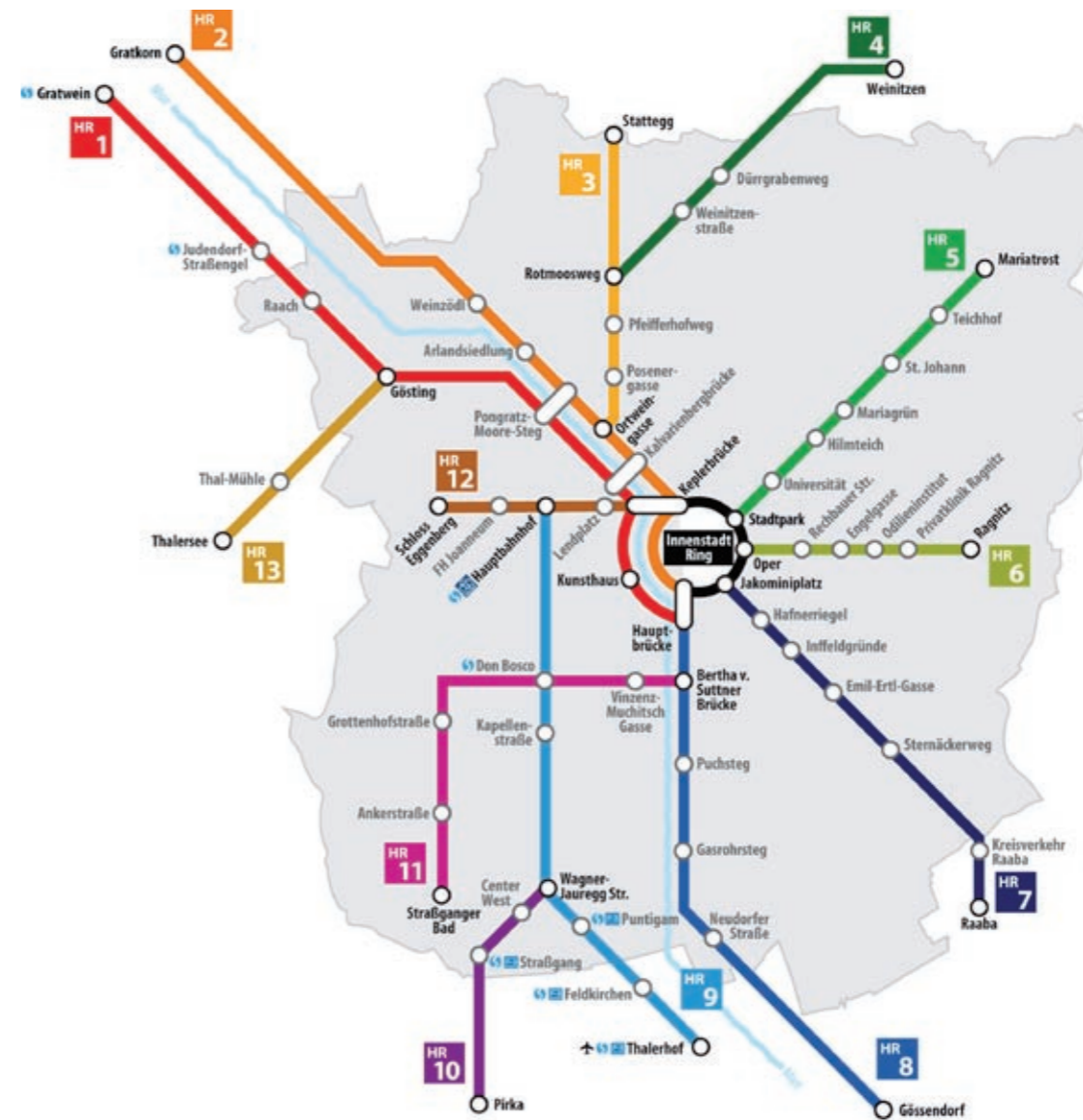
Die neue Übersichtskarte über die Grazer Haupt-radwege erinnert an U-Bahn-Pläne: Die einheitliche und durchgängige Beschilderung entlang dieser Routen soll den RadfahrerInnen die Orientierung erleichtern.