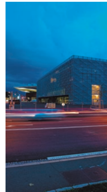
Architektur als Landmarke.