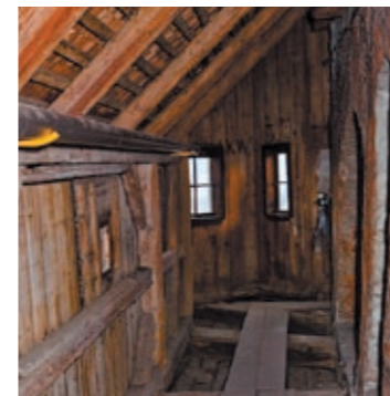
Blick in den Wehrgang.