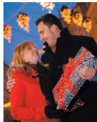
Graz im Advent: Romantik pur!

Nur noch zwei Monate – dann steht Weihnachten vor der Tür. In Graz ist der Advent die „Fünfte Jahreszeit“ mit einzigartiger Atmosphäre: Das Rathaus als Adventkalender, die monumentale Eiskrippe im Landhaushof, die stimmungsvollen Adventmärkte (Eröffnung am 21. November, 16 Uhr) machen die Grazer Altstadt zu einem unglaublich romantischen und faszinierenden Ort. Weitere Informationen bei Graz Tourismus, Herrngasse 16, www.graz-tourismus.at , Tel. 0 31 6/80 75-0